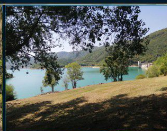
LAGO DEL TURANO NATURA E SPORT OUTDOOR