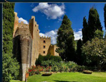
CASTELLO SFORZA CESARINI