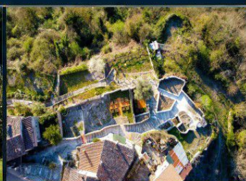
HORTUS DE SINIBALDI